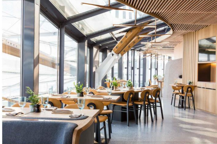
Le paris-brest

Ville étudiante, culturelle et en plein renouveau gastronomique, Rennes a beaucoup à offrir au voyageur qui en ferait sa porte d'entrée de la Bretagne, comme au visiteur professionnel uniquement en escale. Aux deux, on ne saurait trop conseiller de commencer par s'attabler au paris-brest by christian le squer , érigé en plein cœur de la gare de Rennes. Magnifique vaisseau amiral imaginé par l'agence Jouin & Manku, le restaurant, coraqué par le chef étoilé, donne un parfait avant-goût du style AR. Car ce buffet de gare sublimé est à la fois design, gourmand, accessible et au plus proche des voyageurs.