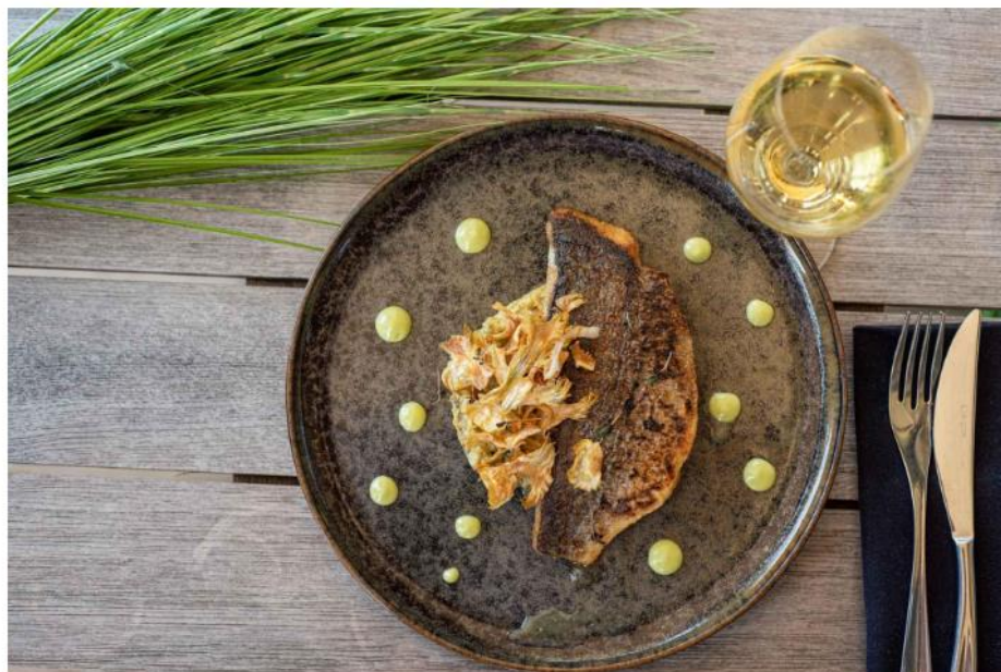
Retour de pêche