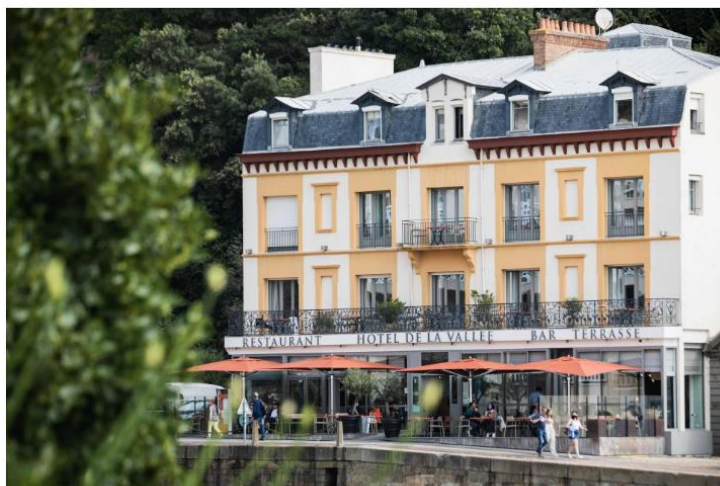
Hôtel La Vallée

Connue pour ses villas majestueuses à flanc de falaise, sa promenade du Clair de Lune et son festival du film britannique, Dinard est une élégante qui ne se laisse pas facilement conquérir. Cette impression sera vite balayée à l' Hôtel de la Vallée , dont l'accueil et la générosité sont les marques de fabrique. Tout juste rénové, l'hôtel est situé au pied de l'embarcadère de l'anse du Bec de la Vallée, ce qui en fait le point de départ idéal pour visiter en bateau toutes les merveilles de la côte d'Émeraude. Et, comme un bonheur n'arrive jamais seul, la splendide terrasse de l'hôtel est baignée de soleil à l'heure du déjeuner... On y déguste, à peine déchargés par les bateaux des pêcheurs, des merveilles comme les Saint-Jacques d'Erquy, des oursins, ou les amandes de mer en persillade, un must !